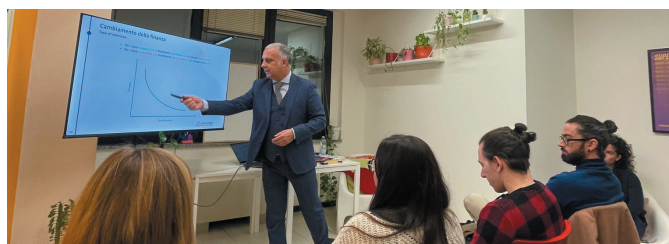
Pianifica la Mente a Gavardo (BS)

Anasf si pone l'obiettivo di spiegare l'importanza della pianificazione finanziaria, riflettendo sugli errori da non fare e individuando le principali regole guida da seguire per raggiungere il benessere economi-