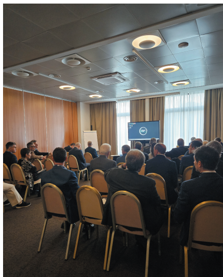
I lavori delle Commissioni di studio