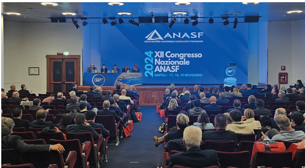
La platea dei delegati al XII Congresso Nazionale Anasf