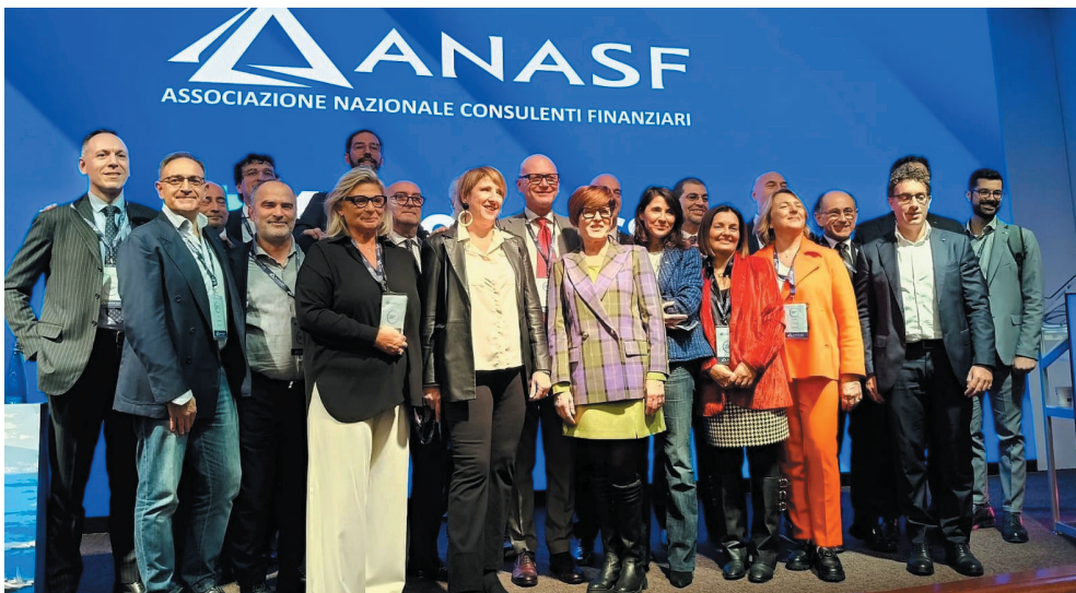
Il Consiglio Nazionale Anasf

Regolamento Generale e Codice Etico", "Evoluzione della professione, estero e tutele"; "Educazione finanziaria"; "Formazione professionale e Rapporti con l'Università";