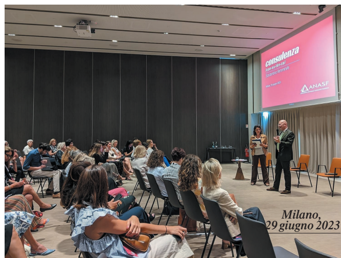
Milano, 29 giugno 2023

partecipazione al percorso di formazione online hanno portato alla creazione di un format di incontri - sempre targati "Consulenza, sostantivo femminile" - dedicati ai professionisti e alle professioniste del risparmio. Gli eventi in presenza si sono svolti il 29 giugno 2023 a Milano; il 30 ottobre 2023 a Napoli; il 21 marzo 2024 a Roma in occasione dell'ultima giornata di ConsulentiTia e il 13 giugno scorso a Palermo, riunendo consulenti