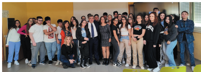
Istituto Superiore G. Minutoli - Messina

Sono numerosi anche i cittadini raggiunti con Pianifica la Mente - METTI IN CONTO I TUOI SOGNI, progetto attraverso il quale