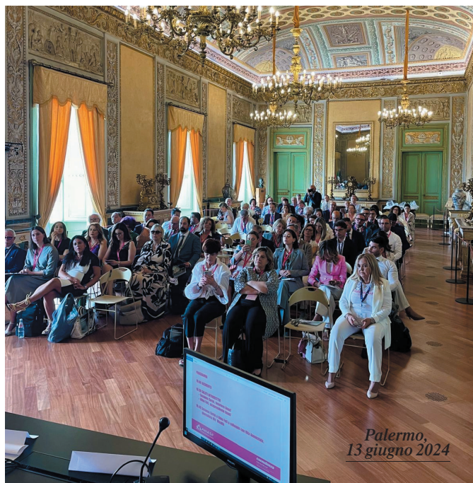
Palermo, 13 giugno 2024

A giugno 2022 è partito il percorso pilota di formazione online dedicato alle socie, organizzato con Learning Edge e replicato anche nel 2023 con il nome Consulenza - sostantivo femminile , coniato in occasione di ConsulentiTia e diventato, dal 15 luglio 2024, marchio registrato.