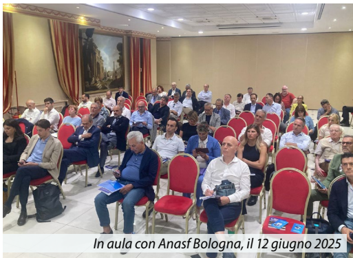
In aula con Anasf Bologna, il 12 giugno 2025