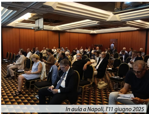
In aula a Napoli, l'11 giugno 2025