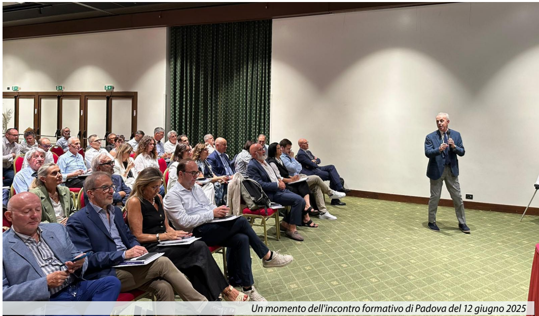
Un momento dell'incontro formativo di Padova del 12 giugno 2025