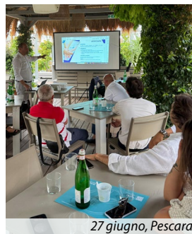
27 giugno, Pescara