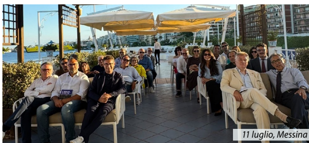
11 luglio, Messina

Gli appuntamenti con l'Associazione e i suoi Comitati territoriali proseguiranno dopo la pausa estiva, per rimanere aggiornati e partecipare visitare il sito www.anasf.it .