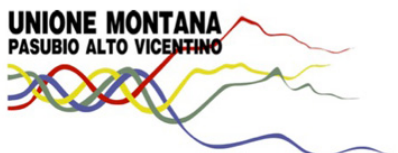
UM Pasubio Altovicentino